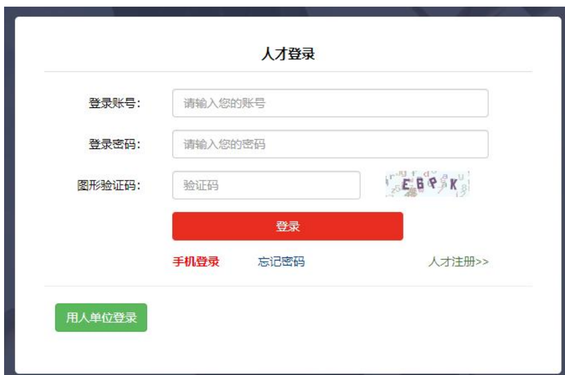
襄阳人才综合服务平台登录窗口