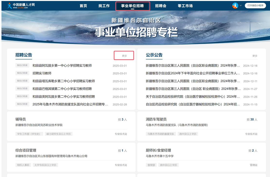
图 7 事业单位招聘