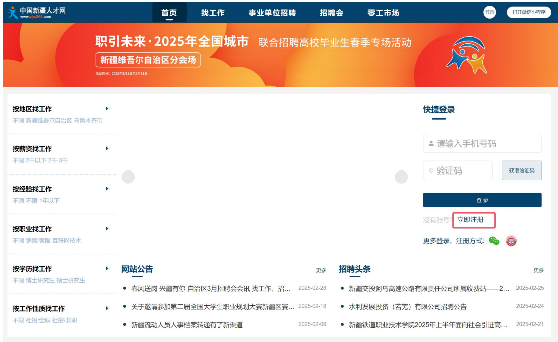
图 2 注册选择