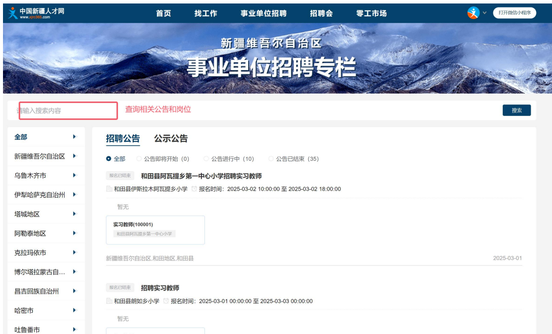
图 8 公告/岗位查询