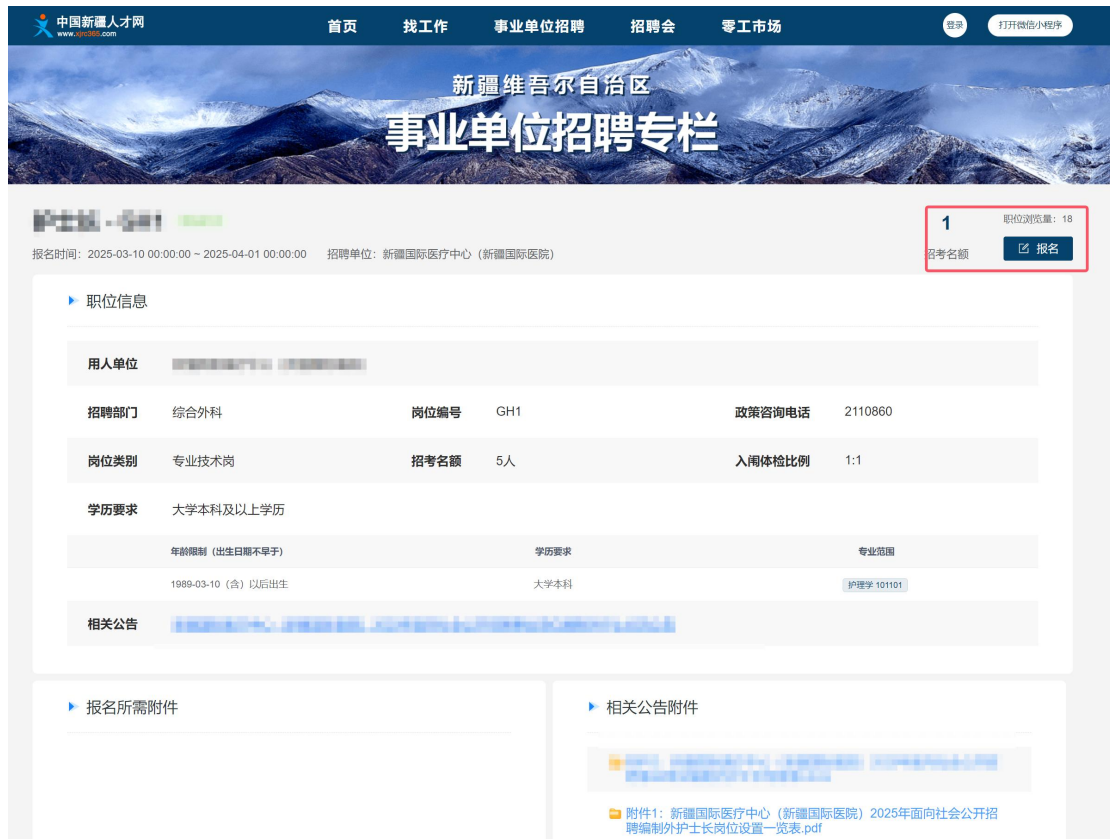
图 10 报名入口