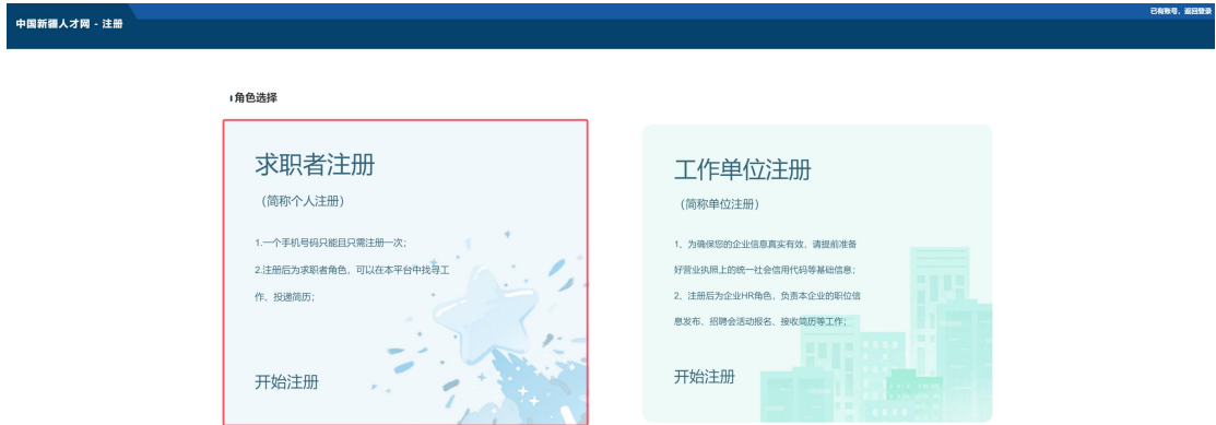
图 3 求职者注册选择