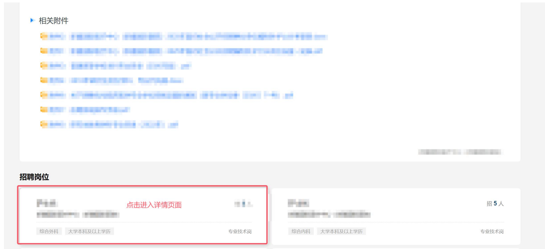
图 9 公告岗位